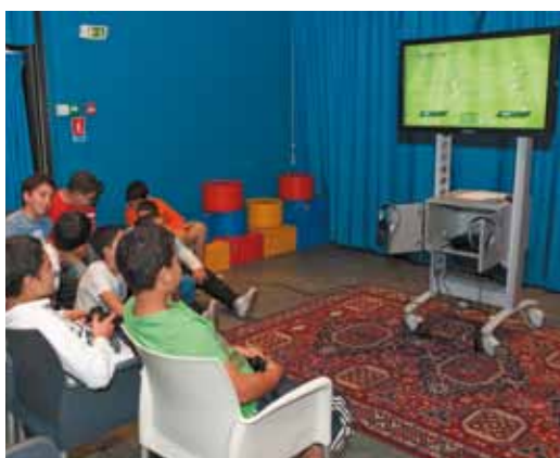
▲ Tournoi de PS3 à la médiathèque Victor Hugo.

Les médiathèques de Montpellier Agglomération proposent de nombreuses animations culturelles, adaptées aux différents publics. Les usagers ne s'y trompent pas : un tiers d'entre eux fréquentent les médiathèques pour d'autres raisons que l'emprunt de documents. Ateliers, spectacles, jeux, auto-formation... Chacun y trouve son intérêt. Tour d'horizon.