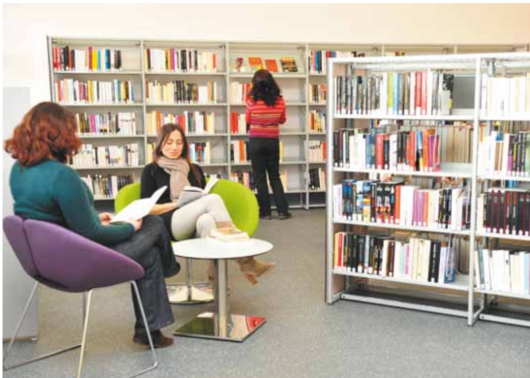
▲ Des espaces de lecture agréables sont aménagés dans toutes les médiathèques.

Grâce au réseau mis en place et comptant aujourd'hui 11 médiathèques, tous les habitants de la Communauté d'Agglomération de Montpellier bénéficient d'une offre de qualité diversifiée à proximité de chez eux. Un réseau disponible 7 jours sur 7 et 24h sur 24.