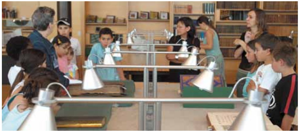
▲ Atelier découverte de la reliure à la médiathèque Emile Zola.

Divers ateliers sont mis en place tout au long de l'année dans tous les établissements du réseau, pour tous les publics. L' initiation à l'informatique est proposée aux tout-petits comme aux seniors. Les ateliers scientifiques animés par l'association « Les Petits Débrouillards » ont beaucoup de succès, de même que les ateliers d'écriture pour adultes, à l'ambiance décontractée. Les nouvelles formes d'expression culturelles ont aussi leur place : ateliers de dessin manga , et très récemment, ateliers de slams . C'est la médiathèque William Shakespeare, très en phase avec la vie du quartier Petit-Bard, qui a lancé cette activité avec l'association « Lâche les mots ». Un groupe d'une quinzaine d'enfants fréquente assidûment cet atelier slam qui leur permet de libérer leur parole.