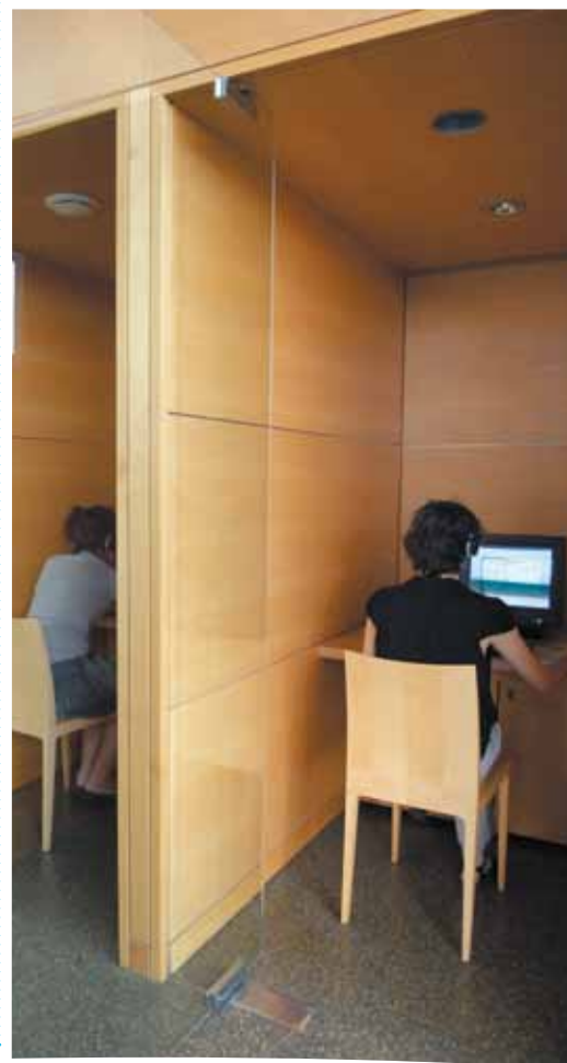
▼ Les cabines d'auto-formation de la médiathèque Émile Zola.

Montpellier Agglomération a contracté de nombreux abonnements à des bases de données en ligne : encyclopédies, dictionnaires de référence, archives des sites de journaux, bases spécialisées (dans le domaine du droit, des arts, des lettres, de l'histoire...)