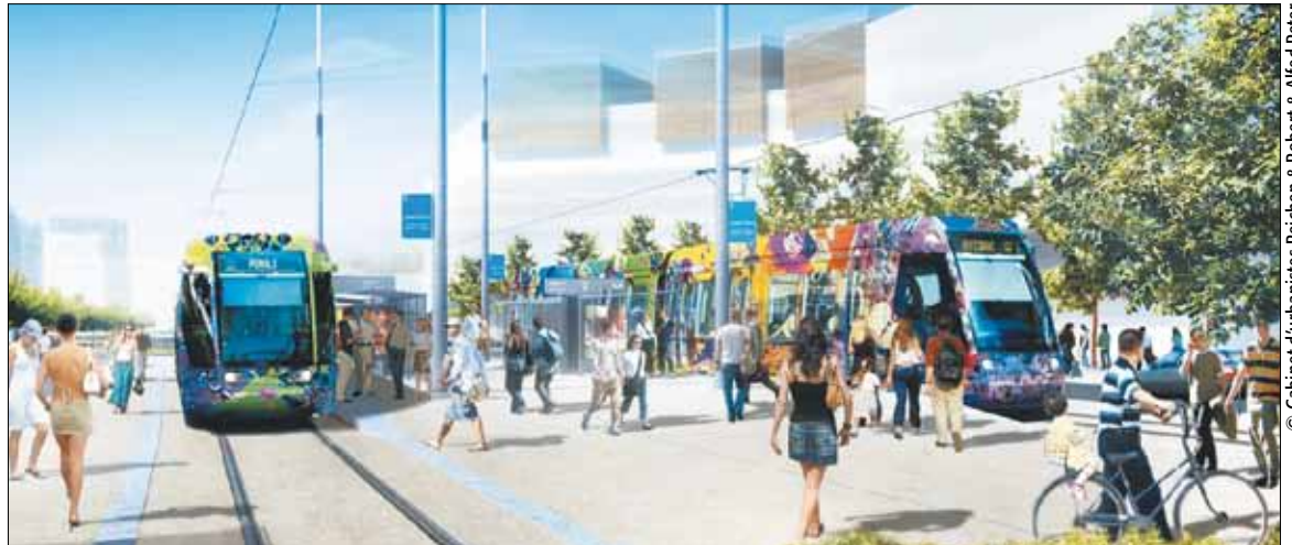
Sur l'avenue Raymond Dugrand, l'espace de voirie sera harmonieusement partagé entre les différents modes de transport.

Montpellier Agglomération construit l'agglomération de demain avec ce projet phare : l'aménagement autour de l'avenue Raymond Dugrand, reliant le centre urbain au littoral. Un projet pour les 20 ans à venir.