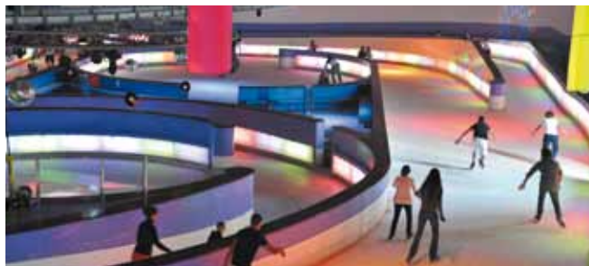
La patinoire Vegapolis.