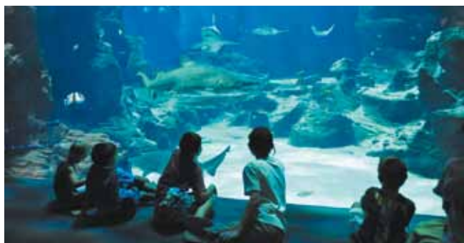
L'Aquarium Mare Nostrum.

Odysseum attire chaque année de plus en plus de visiteurs, habitants de l'agglomération, de la région et touristes du monde entier. Aquarium, planétarium, cinéma, patinoire, mur d'escalade... Il y a de quoi distraire toute la famille. Et ce n'est pas terminé !