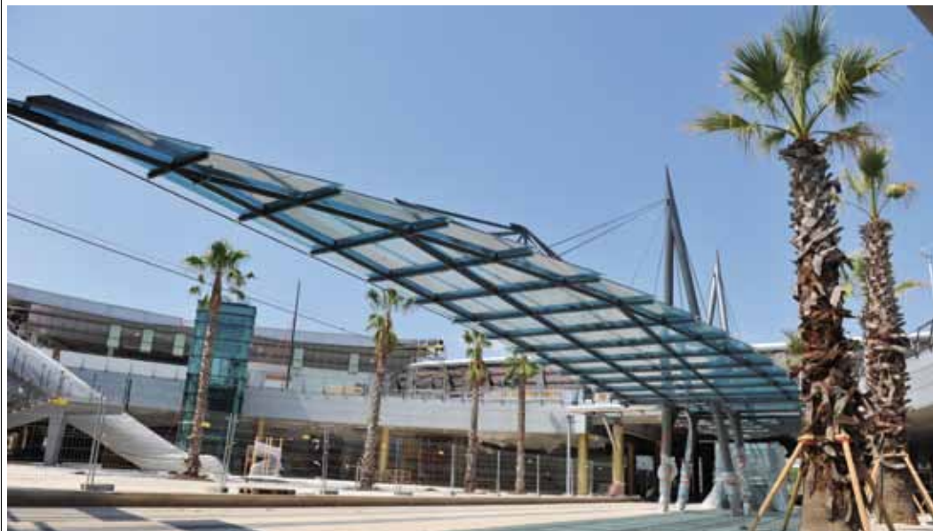
La nouvelle station de tramway «Odysseum» en plein cœur du centre commercial.

Hypermarché, enseignes internationales, franchises ou commerces indépendants : tout le monde trouve sa place au centre commercial Odysseum ! L'attractivité du site, visité par des millions de personnes chaque année, l'emplacement et la qualité du projet, autant d'atouts qui ont séduit de nombreux commerçants.