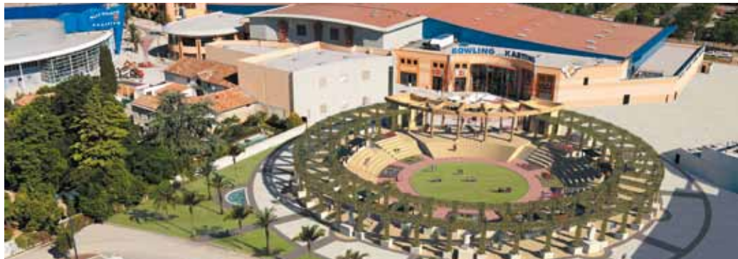
© AG Concept Architecture A.Cuivan C.Kendir A.Picard

L'aménagement de la place du XX e siècle, entre le pôle ludique et le centre commercial, est actuellement en cours. Conçu dans l'esprit de l'agora antique par le cabinet AG Concept Architecture, cet espace circulaire de 60 mètres de diamètre est destiné à accueillir les flâneries des visiteurs, et, ponctuellement, des spectacles de plein air.