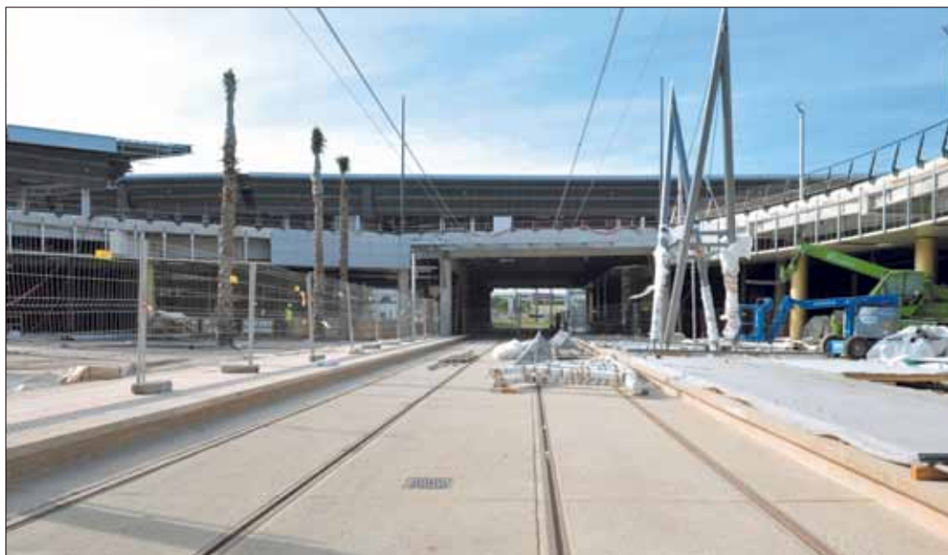
Financés par Montpellier Agglomération et la Région Languedoc-Roussillon, le prolongement de la Ligne 1 et sa nouvelle station « Odysseum » sont en cours d'aménagement au cœur de la galerie commerciale à ciel ouvert.

Descendez de tramway au cœur d'un centre commercial unique en France. Autour de vous : une galerie de 100 boutiques, à ciel ouvert, et un hypermarché de la taille de deux terrains de football... Bienvenue à Odysseum, un site imaginé et créé par Montpellier Agglomération.