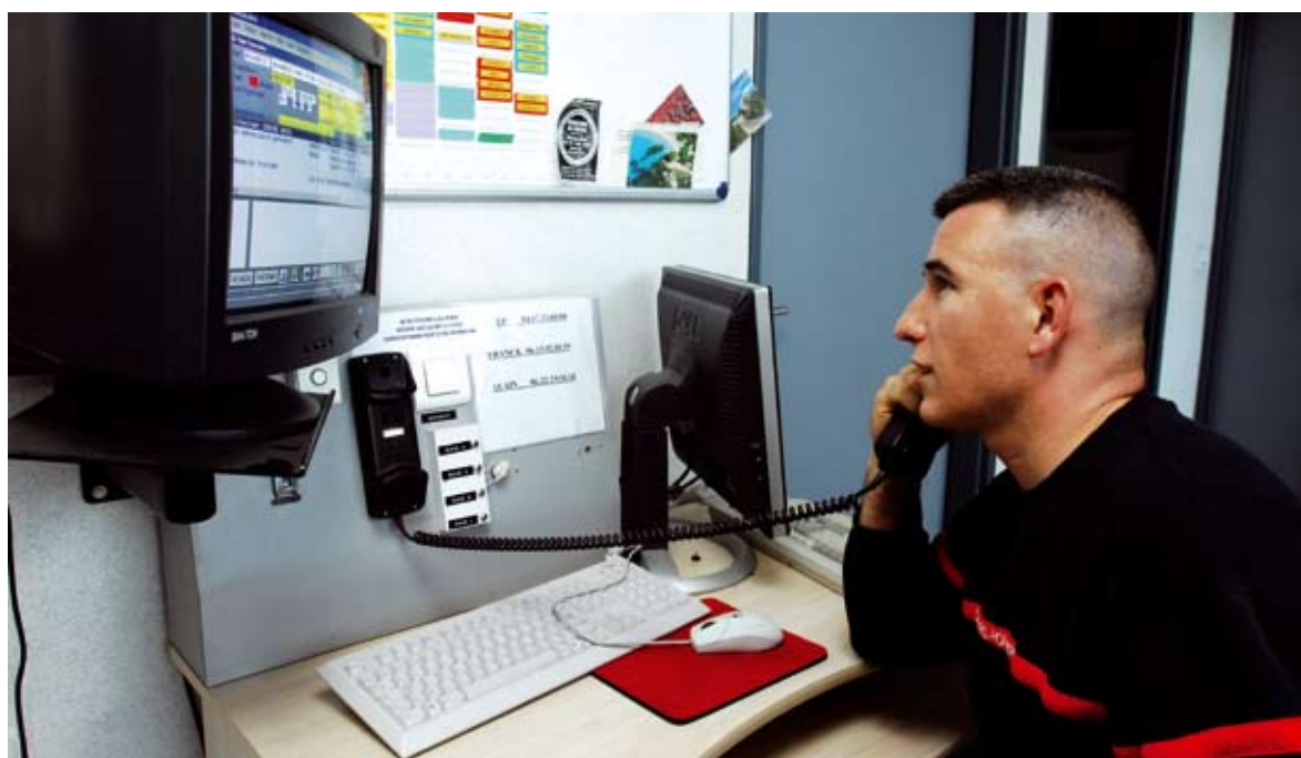
Au bout du fil, en lien direct avec l'utilisateur de la téléalarme, un sapeur-pompier du Centre de secours principal à Montpellier.

Petit boîtier rassurant, la téléalarme permet de maintenir les personnes seules à domicile en lien direct avec les pompiers en cas d'urgence. Montpellier Agglomération apporte ce service de proximité très utile à plus de 1 500 personnes sur le territoire.