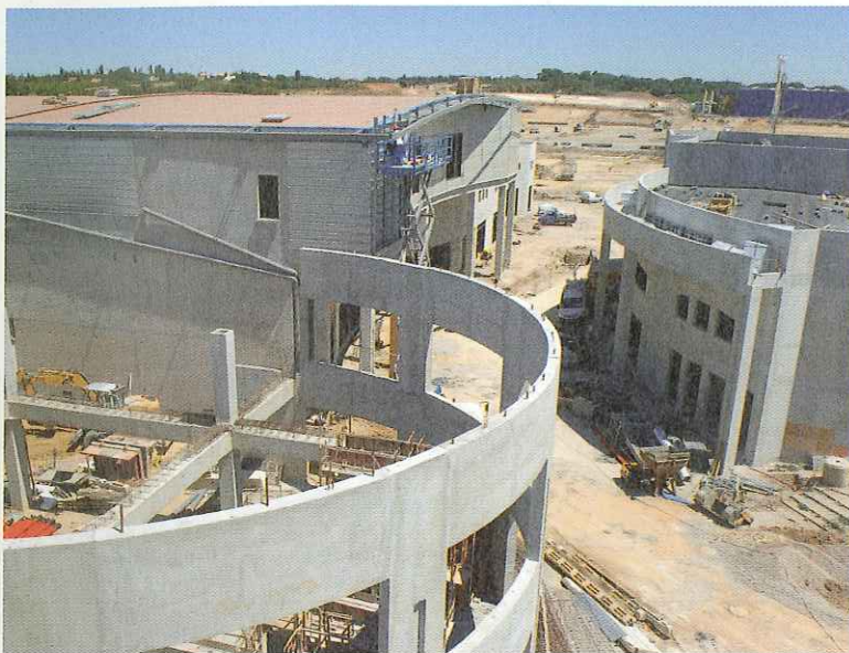
Le pôle ludique s'agrandit. Dès la fin de l'année, de nouveaux équipements verront le jour.

Deux cabinets d'architecture de renom ont conçu le futur centre commercial d'Odysseum : les Londoniens Design International à l'origine et aujourd'hui DGLa. Agence parisienne, DGLa est spécialisée en architecture commerciale et de loisirs. Elle a notamment réalisé la Galerie Gaïté et la Galerie du 26 Champs-Élysées à Paris et a restructuré le centre Rosny 2 en région parisienne.