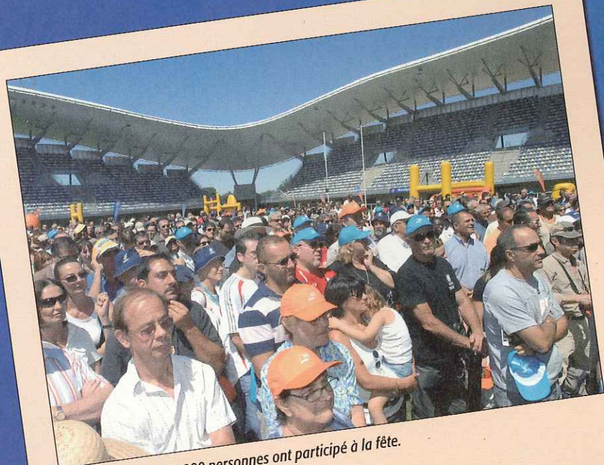
Le 23 juin, plus de 5 000 personnes ont participé à la fête.

La foule était au rendez-vous à Yves du Manoir. Le 23 juin, plus de 5000 personnes ont pénétré dans le premier stade de l'ère professionnelle construit en France. Une inauguration populaire et chaleureuse.