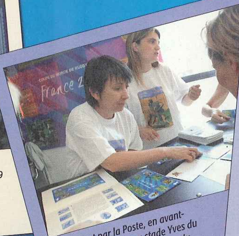
Lancement par la Poste, en avant-première nationale au stade Yves du Manoir, du bloc timbres Coupe du Monde de Rugby 2007.