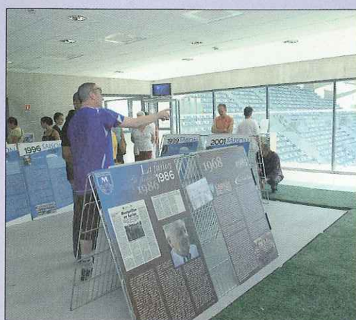
Cette journée portes ouvertes a permis au public de visiter librement le stade, des vestiaires aux tribunes en passant par les salles de réception...