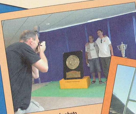
Succès garanti pour la photo souvenir offerte à tous devant le bouclier de Brennus et le trophée du Tournoi des Six Nations sortis exceptionnellement pour l'événement.