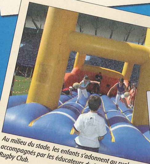
Au milieu du stade, les enfants s'adonnent au rugby-parc accompagnés par les éducateurs du Montpellier Hérault Rugby Club.