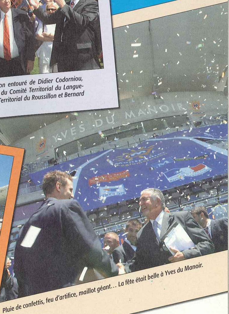
Pluie de confettis, feu d'artifice, maillot géant... La fête était belle à Yves du Manoir.