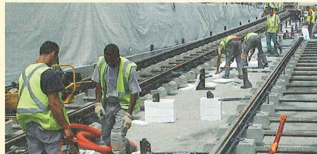
Le chantier ligne 2 a réservé de nombreuses heures de travail à un public en insertion.

- 3 500 visiteurs ont participé en 2005 aux Rencontres pour l'emploi soutenues par Montpellier Agglomération et organisées dans différentes communes.