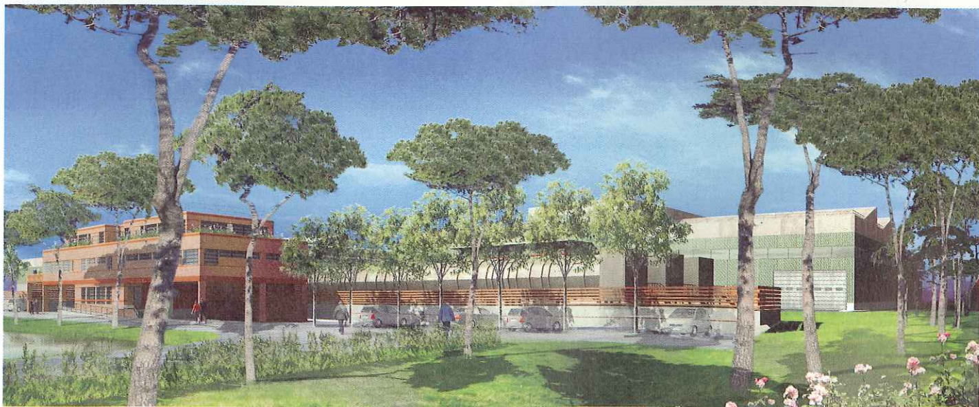
La future usine de méthanisation.

Ces crédits ne seront engagés qu'à condition que l'Etat respecte ses propres engagements en la matière.