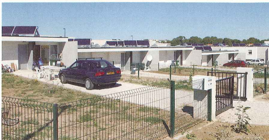
Le Casale, premiers logements sociaux en location-accession à Montpellier.

• Parc locatif privé : l'objectif est de réhabiliter une centaine de logements dans le cadre des dispositifs d'amélioration de l'habitat.