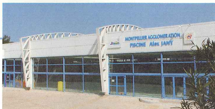
La piscine Alex Jany à Jacou.

La construction de ce complexe unique en France, a été mise en œuvre pour répondre aux nouveaux besoins du rugby dans l'Agglomération. Son ouverture coïncidera avec celle de la Coupe du Monde de Rugby 2007.