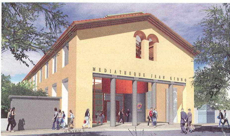
La médiathèque Jean-Giono ouvrira au printemps 2008 à Pérols.