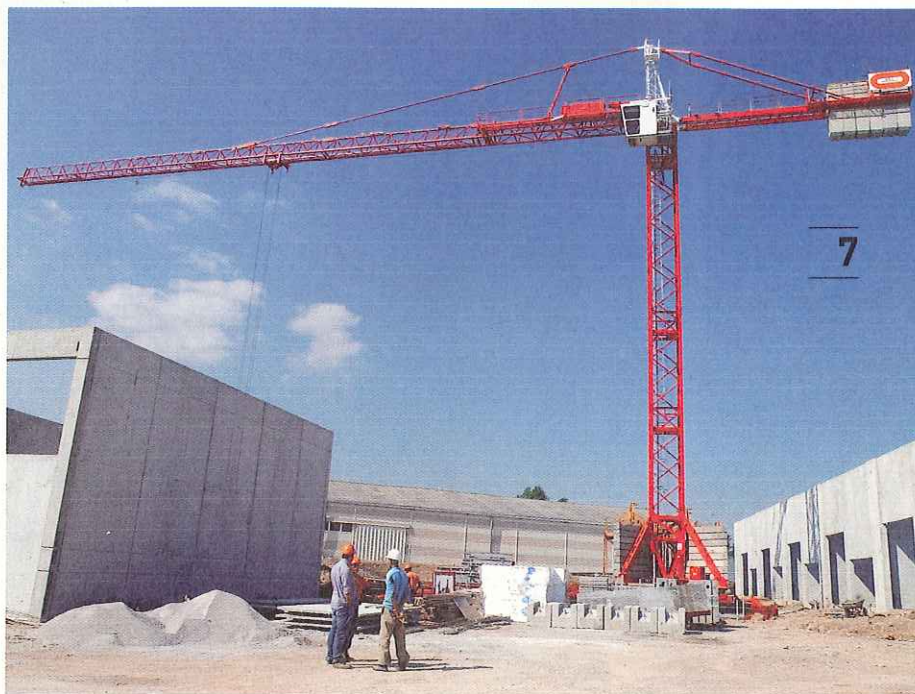
Le village d'entreprises Hannibal à Cournonsec.