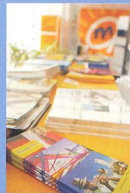
Toutes sortes d'informations sont disponibles.