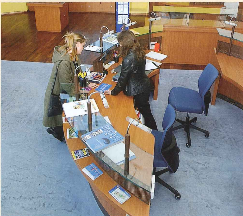
La Maison de l'Agglomération à Odysseum Port Marianne.