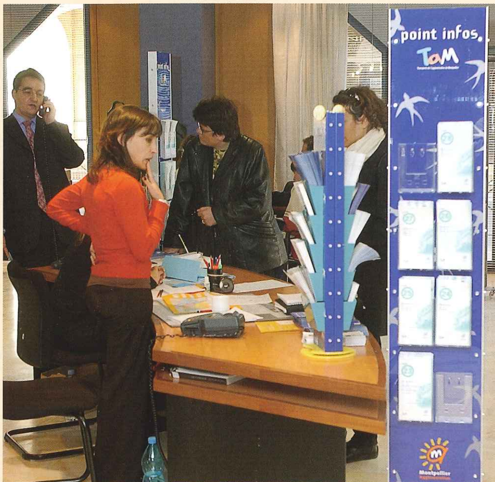
La Maison de l'Agglomération Centre.