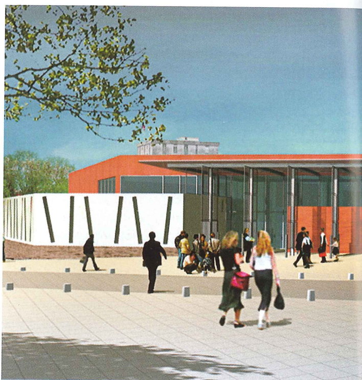
Médiathèque William-Shakespeare à Montpellier Cette sixième médiathèque d'Agglomération ouvrira au printemps 2005. Plus de 1 000m 2 au cœur du quartier des Cévennes, 22 000 livres, près de 10 000 CD et Cd rom, 18 postes informatiques... Coût des travaux : 3,7 M€.