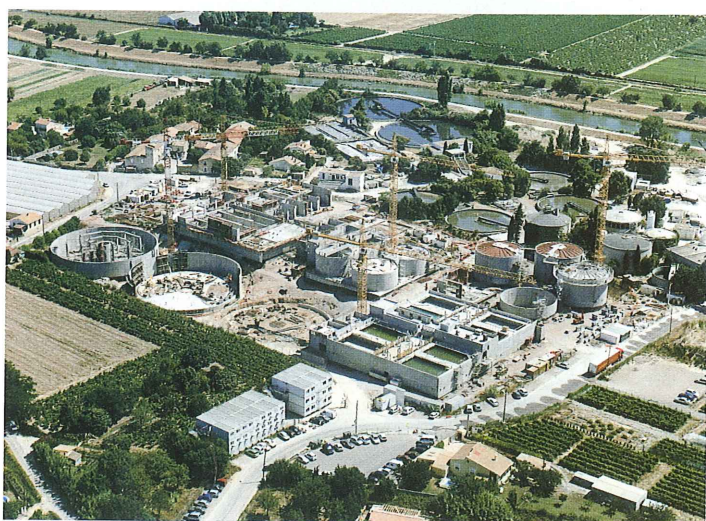
Station d'épuration de la Céreirède à Lattes Rénovée et agrandie, elle va traiter 470 000 équivalent habitants contre 260 000 auparavant.

Parallèlement à la poursuite de grands chantiers comme la ligne 2 du tramway ou le musée Fabre, Montpellier Agglomération lance de nouvelles opérations : l'aquarium Mare Nostrum, le stade de rugby Yves-du-Manoir ou la médiathèque Françoise-Giroud. La preuve en images.