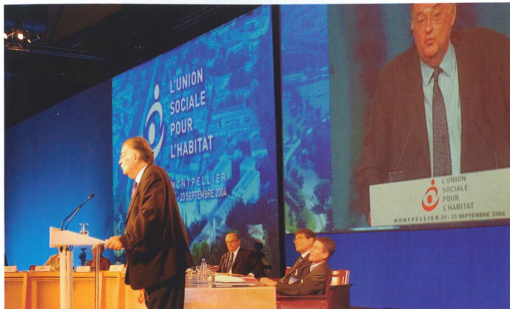
Georges Frêche, président de Montpellier Agglomération et de la région Languedoc-Roussillon Septimanie lors de l'inauguration du congrès de l'Union sociale pour l'habitat.

Le congrès Interoute a accueilli près de 300 exposants, acteurs de la construction, de l'entretien et de la sécurité des routes.