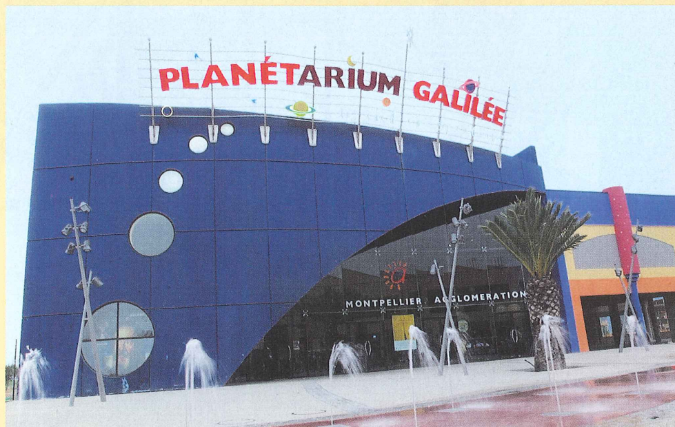
Destination espace au cœur du Planétarium Galilée