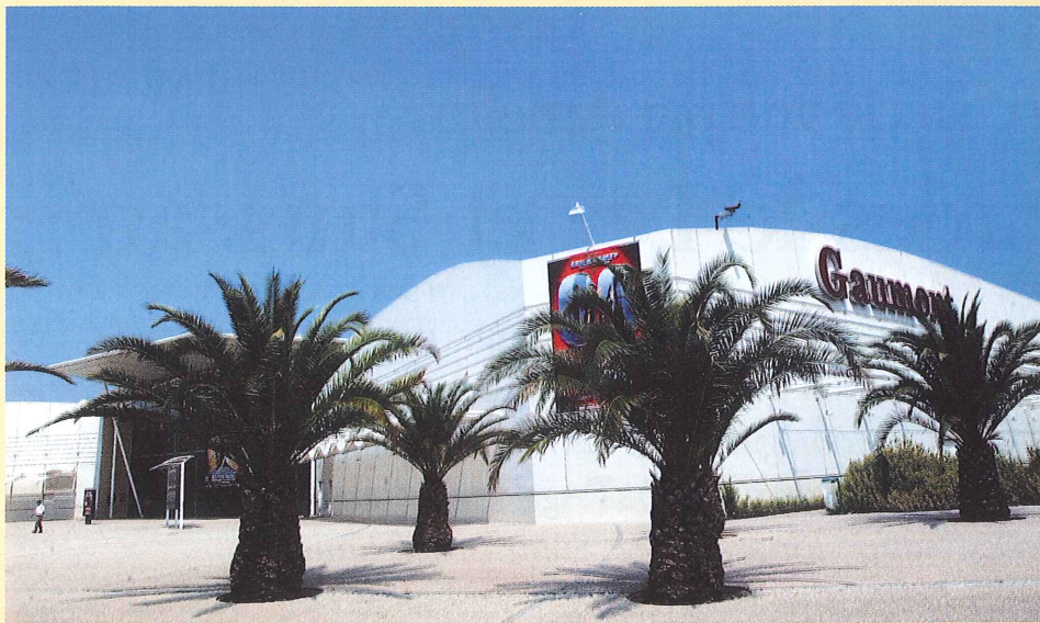
Plus d'un million de spectateurs fréquentent chaque année le Gaumont Multiplexe.

de 120 boutiques. Sans oublier Décathlon qui occupera 8 500 m 2 . Ici, pas question de faire n'importe quoi. Aménageur d'Odysseum, la Serm (Société d'économie de la région montpelliéraine) confirme : « Il s'agit de bâtir une galerie ouverte sur la lumière naturelle et la végétation environnante, en hommage à la rue piétonne ; un centre commercial axé sur la consommation-plaisir où l'offre, qui comprendra 70 % d'enseignes qui ont déjà fait leurs preuves et 30 % innovantes, sera complémen-