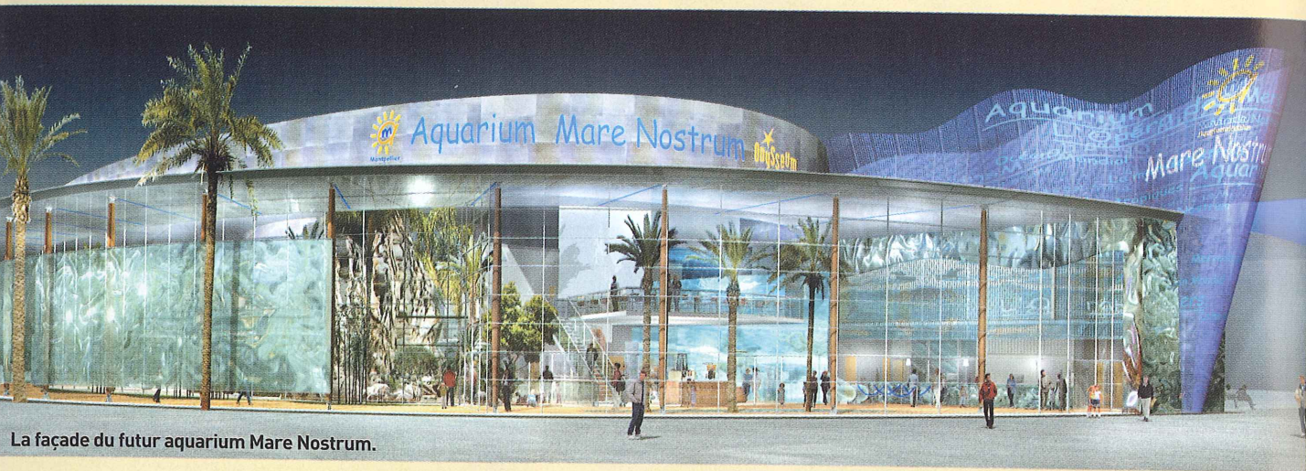
La façade du futur aquarium Mare Nostrum.