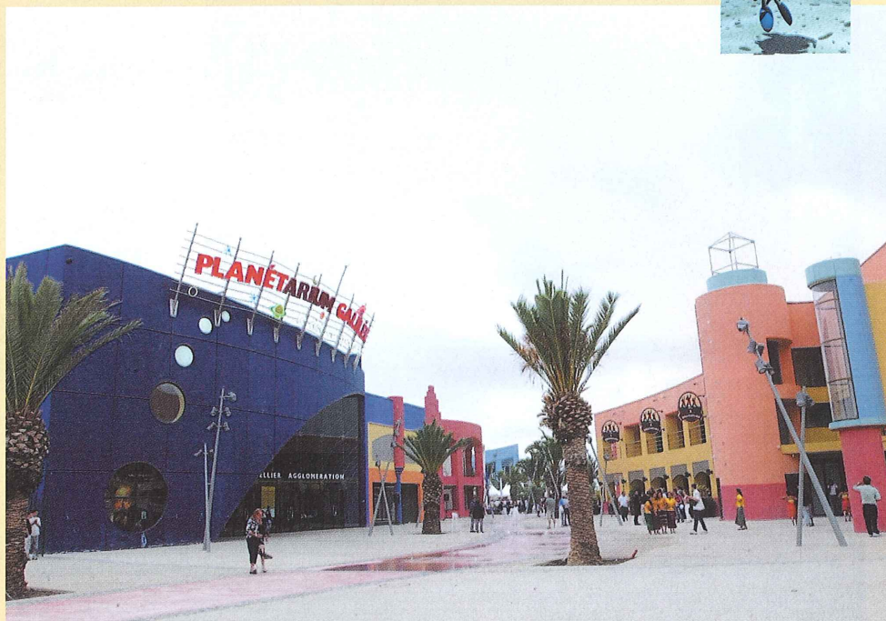
Avec ses nouveaux équipements, Odysseum prend forme.

I nauguration, permis de construire déposés, chantiers en cours : petit à petit, Odysseum s'installe, son concept innovant qui mêle équipements ludiques et commerces prend forme. Malgré les aléas juridiques de ces dernières années, l'odyssée se poursuit. Pour preuve, le nombre d'équipements ne cesse de croître, places et rues prennent leurs marques dans cette zone idéalement située à cinq minutes, en tramway, de la place de la Comédie, à dix minutes des plages et proche de l'autoroute A9. Président de Montpellier Agglomération et initiateur d'Odysseum, Georges Frêche résume : « Des équipements prestigieux, des grandes enseignes, des haltes garderies pour les enfants. A Odysseum, on peut, en une seule journée, se distraire, s'instruire, découvrir, faire ses courses, pratiquer des sports, se détendre, se restaurer ou bien encore danser. Odysseum est conçu pour offrir à chaque visiteur la liberté de vivre pleinement ses temps de loisirs ».