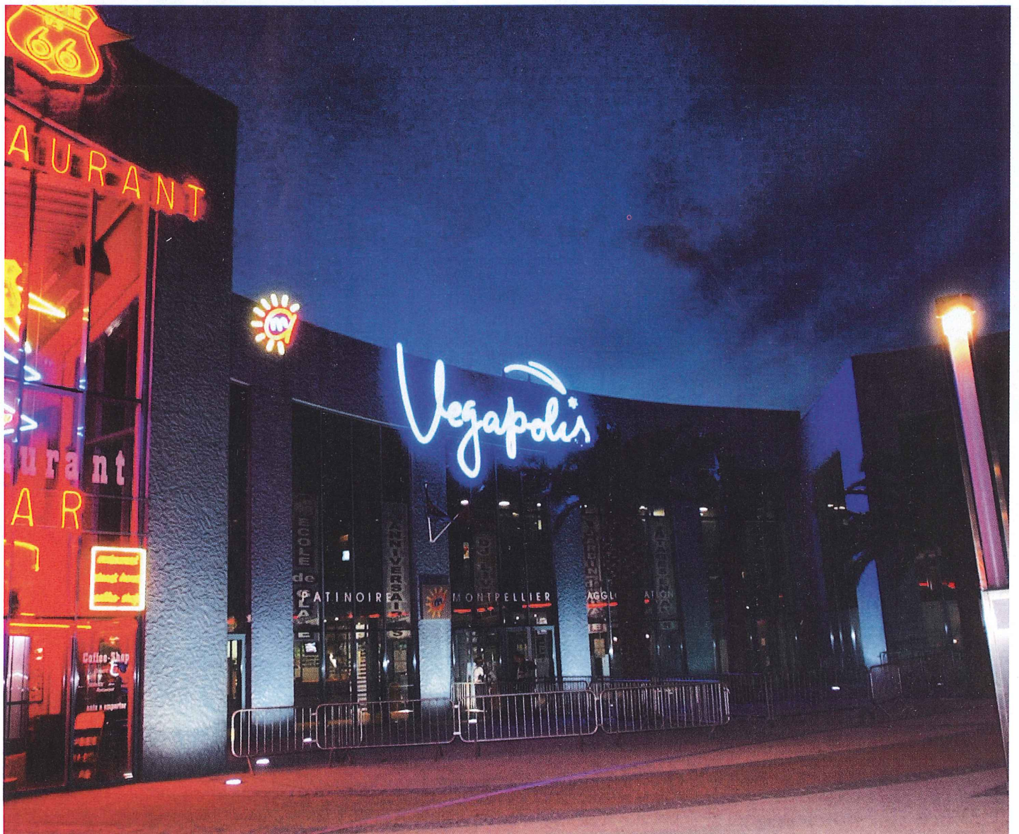
La patinoire Végapolis de nuit.

2004 est l'année Odysseum. Si les équipements en place ont déjà pris leur rythme de croisière voire, pour certains, très largement dépassé leurs objectifs initiaux de fréquentation, d'autres vont apparaître dans les prochains mois. Odysseum prend ses marques, son image se façonne et sa vocation s'affirme. L'odyssée est en marche. Destination loisirs.