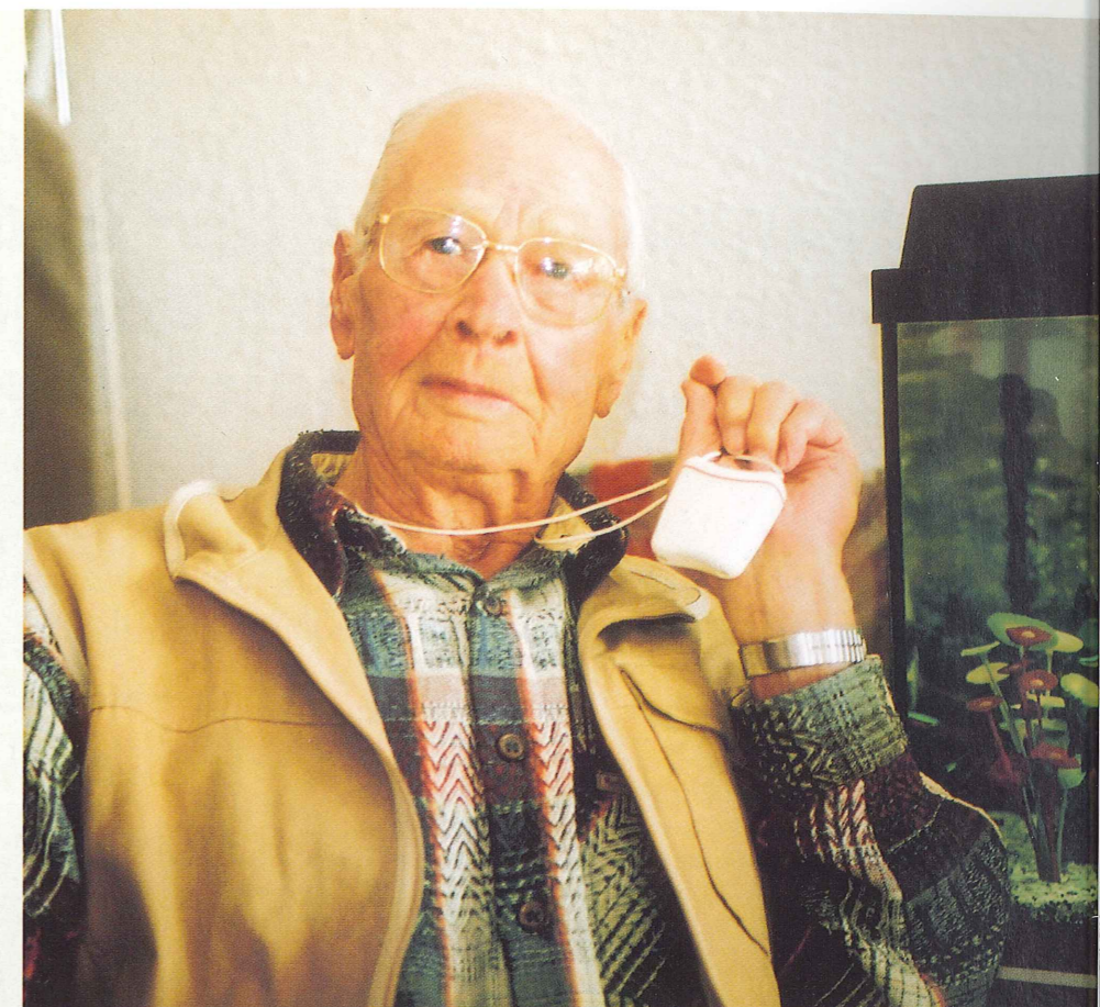
SERVICE TELEALARME A DOMICILE