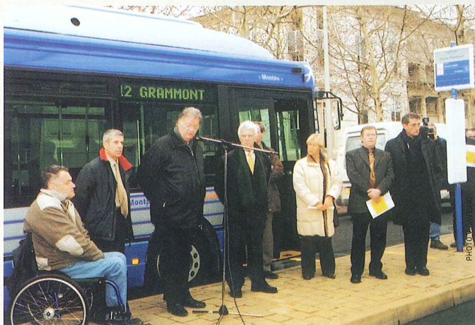
Inauguration de la ligne 12, ligne test pour l'accès aux bus des personnes handicapées.