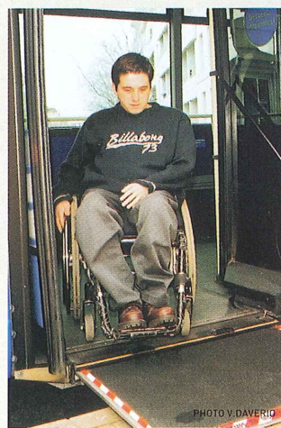
La palette rétractable est située à la hauteur de la porte centrale. En se déployant, elle vient se poser sur le quai.

Depuis cette date, les 11 bus de cette ligne sont équipés d'une