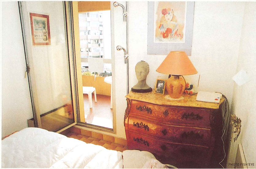
Le terminal de téléalarme est mis en service au domicile de l'abonné par un technicien de Montpellier Agglomération

les services et véhicules adéquats qui se rendront d'urgence à son domicile. Ce système, entièrement informatisé, permet un contrôle permanent de son fonctionnement. Le service Téléalarme de Montpellier Agglomération est automatiquement alerté en cas d'arrêt, de débranchement ou de panne secteur. De jour comme de nuit, la Téléalarme est un bon moyen d'être rassuré 24h/24h. Ce service de Montpellier Agglomération permet aujourd'hui à plus de 900 abonnés de vivre chez soi en toute sérénité, dans leurs meubles, avec leurs habitudes et leurs souvenirs. Alerté par la Téléalarme, les pompiers interviennent en moyenne 27 fois par mois à domicile, le plus souvent pour des chutes sans gravité, mais également pour sauver des vies.