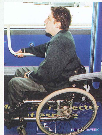
Conformément à la réglementation en vigueur, un espace pour une personne en fauteuil est signalé et réservé au milieu du bus.

palette escamotable pouvant être activée pour l'accès des fauteuils roulants. 21 arrêts de la ligne, soit 50 % des arrêts, sont accessibles à cette palette et à l'abaissement du bus. La période d'expérimentation de cette ligne fera l'objet d'un travail de concertation avec le Comité de liaison des personnes handicapées afin d'améliorer l'accès à l'ensemble de la ligne. En septembre 2003, la ligne 15 Gare - Mosson, dont tous les arrêts ont déjà été aménagés, sera à son tour mise en accessibilité totale.