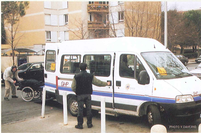
32 minibus aménagés du GIHP transportent les personnes à mobilité réduite des 38 communes de la Communauté d'Agglomération de Montpellier.