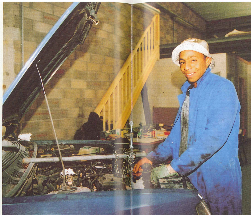
CHANTIER ECOLE D'INSERTION