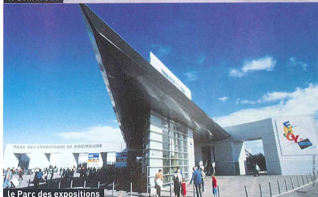
le Parc des expositions