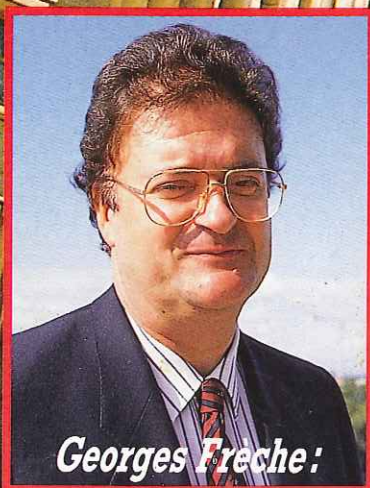
Georges Frêche :

SUPPLÉMENT AU NUMÉRO 284 DU 5 NOVEMBRE 1988