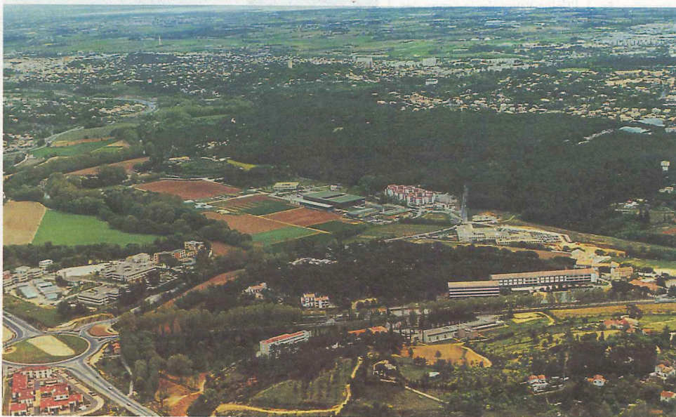
Une vue aérienne du Parc Agropolis qui accueille 150 entreprises, 21 centres de recherche, un exemple du dynamisme de Montpellier

Un dossier publié par le magazine économique l'Entreprise dans son numéro de mars 1992 classe Montpellier en deuxième position des villes de plus de 200 000 habitants, juste après Toulouse.