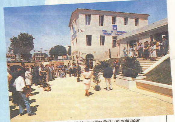
Le Moulin de l'Evêque (entrée A9 Montpellier Est) : un outil pour montrer aux visiteurs les richesses qui font la beauté du cadre de vie de Montpellier et sa région.