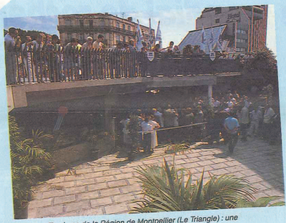
Office de Tourisme de la Région de Montpellier (Le Triangle) : une vitrine de qualité sur la Place de la Comédie.

Et la région de Montpellier ? Jusqu'à présent les produits n'étaient pas d'assez bonne qualité. Aujourd'hui nous trouvons de très bons vins, du