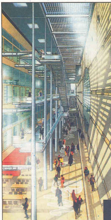
Ci-dessus, vue intérieure au niveau de la rue couverte.