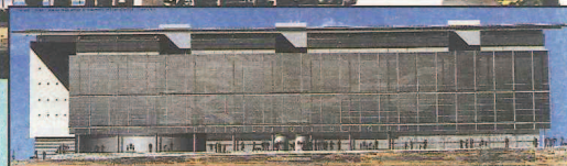
Façade, côté boulevard de l'Aéroport International.

Calendrier prévisionnel Janvier 1998 : démarrage des travaux Juin 2000 : ouverture de la Bibliothèque Municipale à Vocation Régionale Investissement prévisionnel : 250 millions de francs.