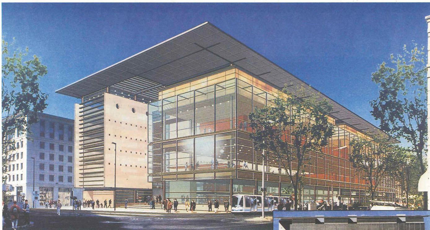
Perspective depuis le croisement du boulevard de l'Aéroport International avec la rue Poséidon.