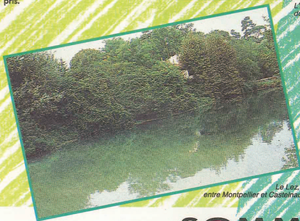
Le Lez, nettoyé entre Montpellier et Castelnau-le-Lez